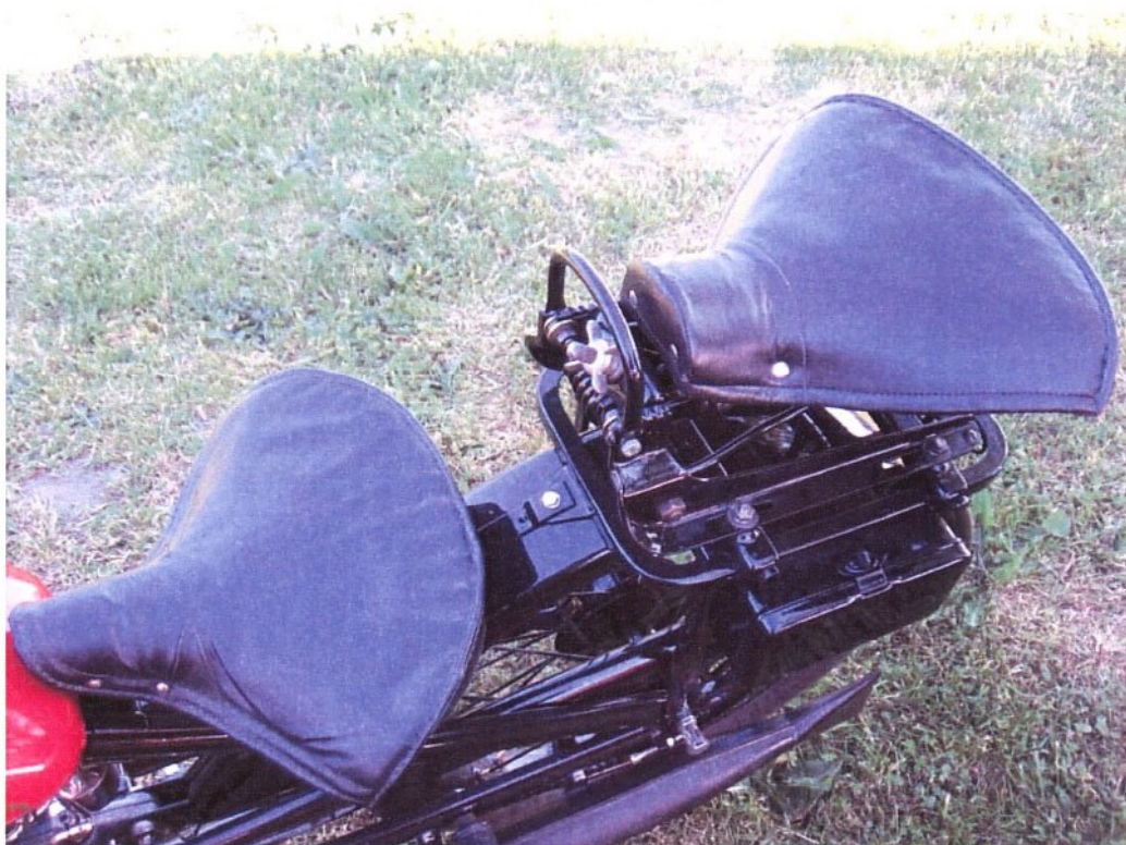
Vaade sõiduki istme(te)le