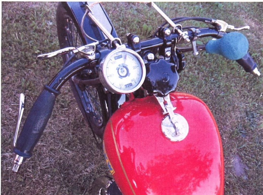
Vaade sõiduki juhtimisseadmetele